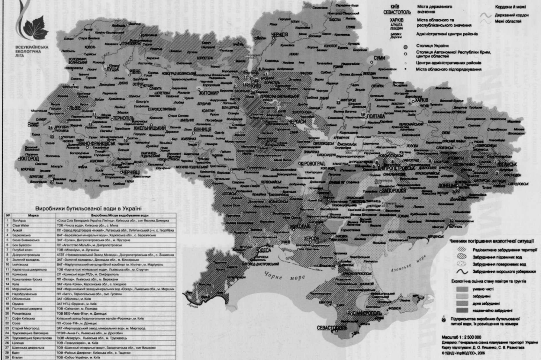
Виробники бутильованої води в Україні