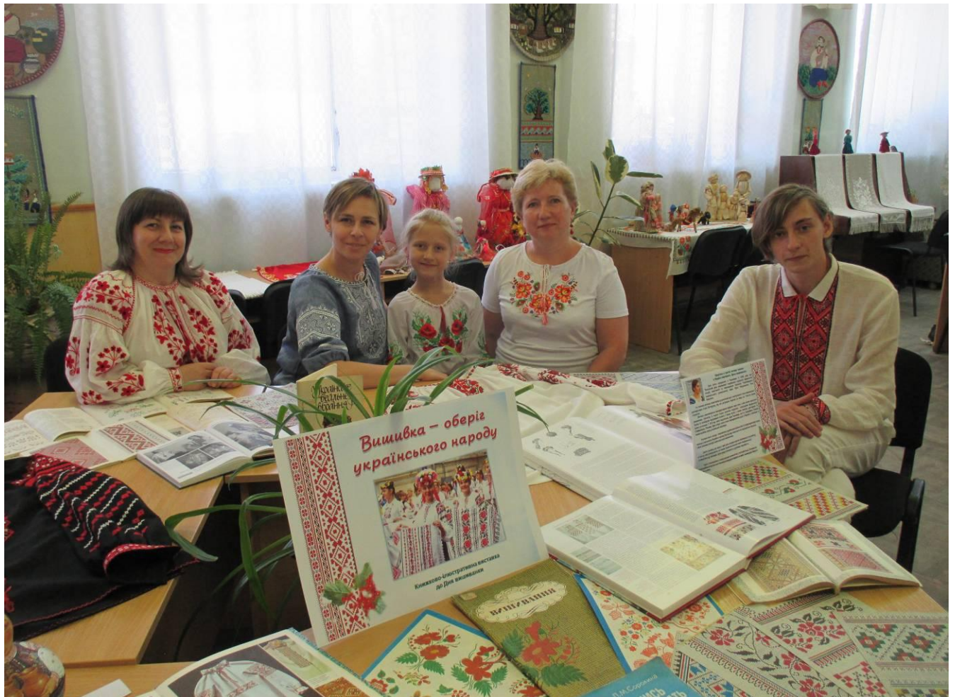
Книжкова виставка «Вишивка – оберіг українського народу» до Дня вишиванки

Особливими попитом користувалися книги під час таких виставок та бібліографічних оглядів: «Вишивка у традиційно-побутовій культурі українського народу», «Мистецтво у світі духовної культури».