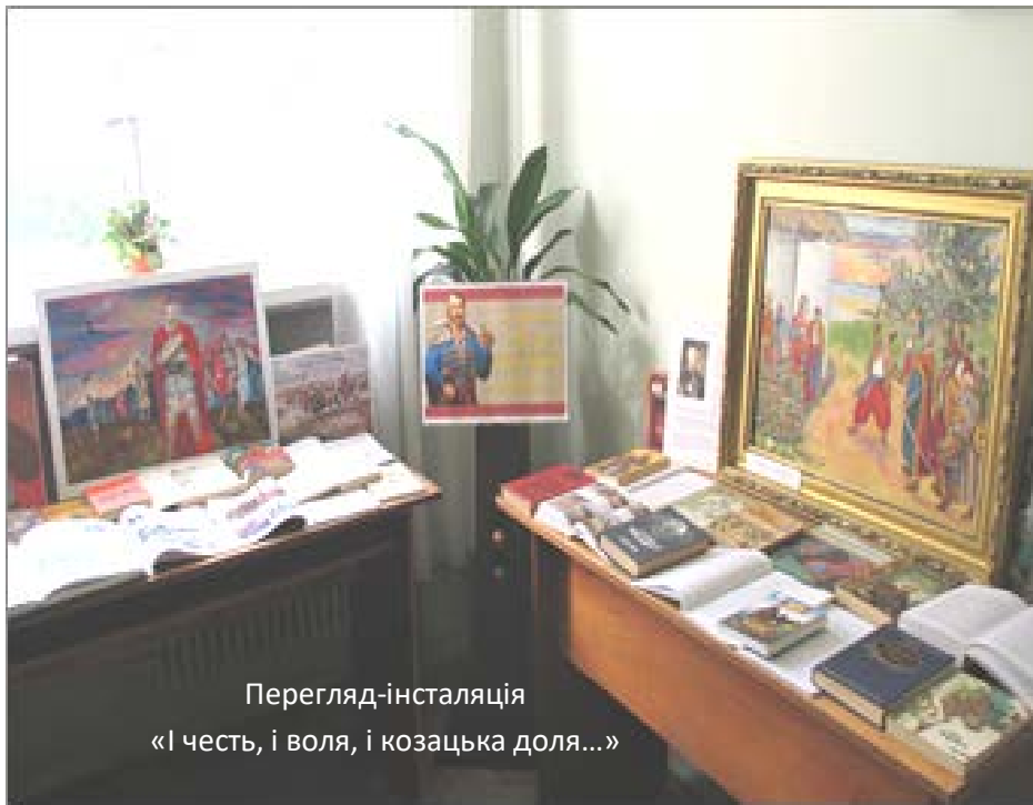
Перегляд-інсталяція «І честь, і воля, і козацька доля...»

Привернув до себе особливу увагу читачів і перегляд, створений до Дня українського козацтва «І честь, і воля, і козацька доля...».