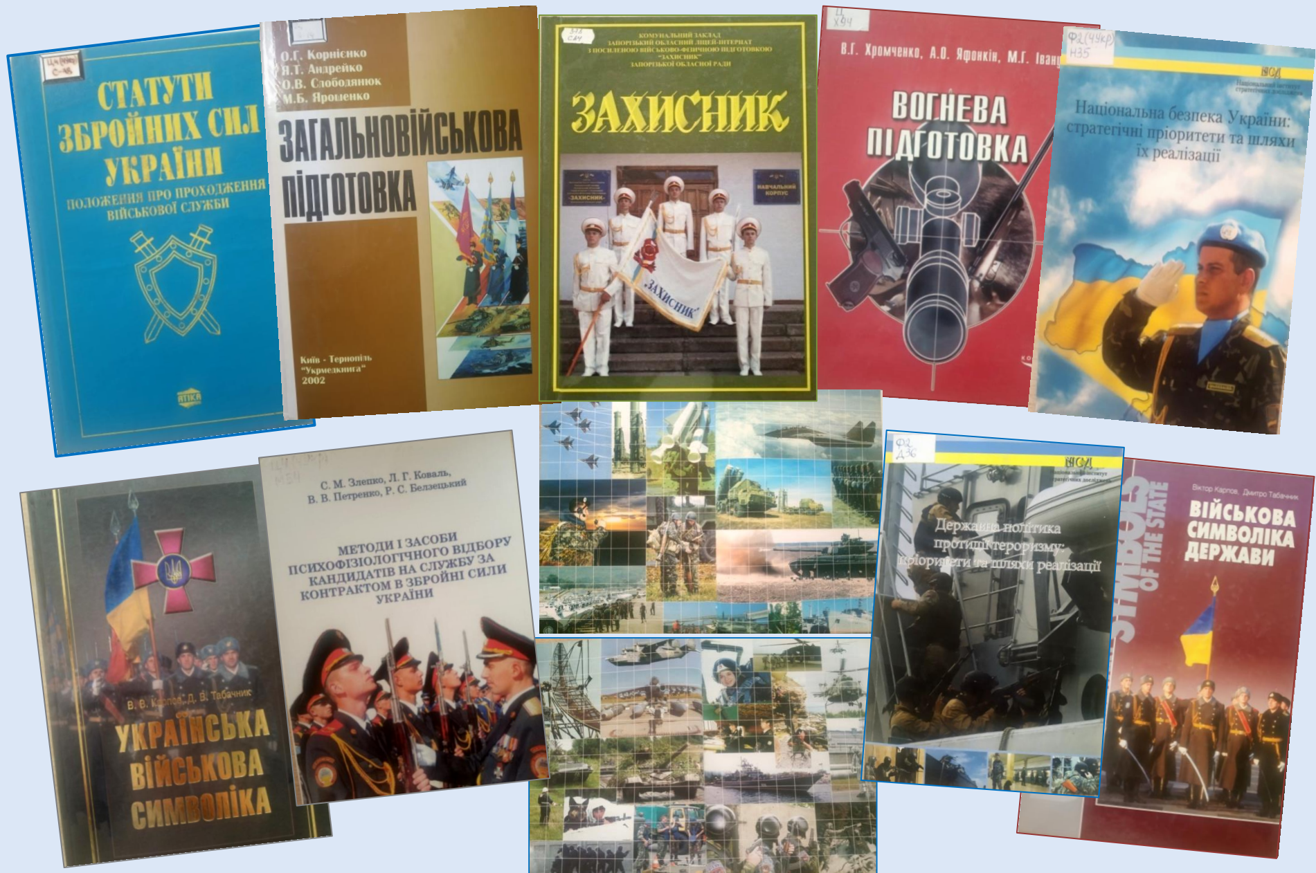
Книжкова виставка до Дня захисників і захисниць України у читальному залі (ауд.513)