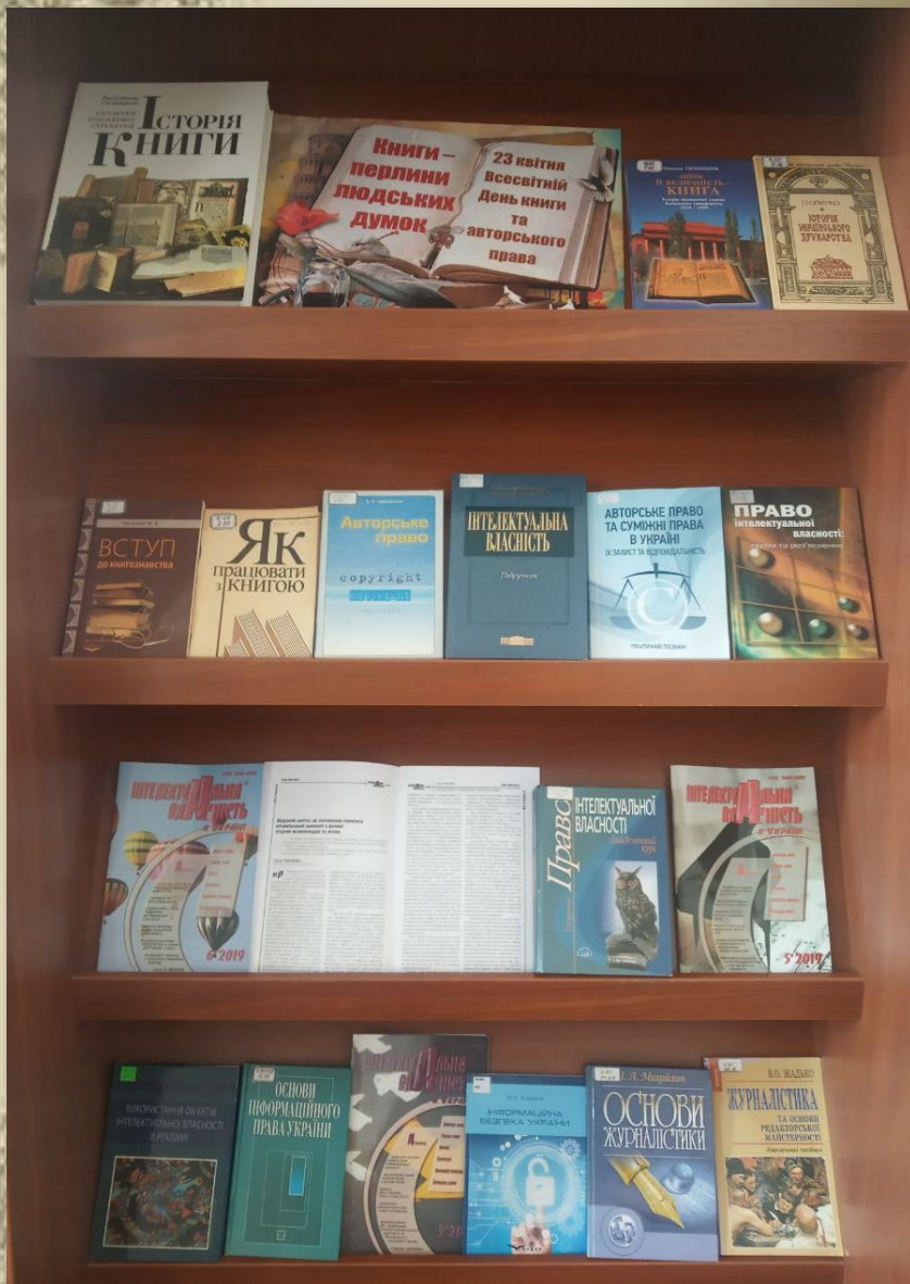
Виставка у читальному залі економіко – гуманітарної літератури (ауд.513)

Книги - морська глибина, Хто в них пірне аж до дна, Той, хоч і труду мав досить, Дивнії перли виносить.