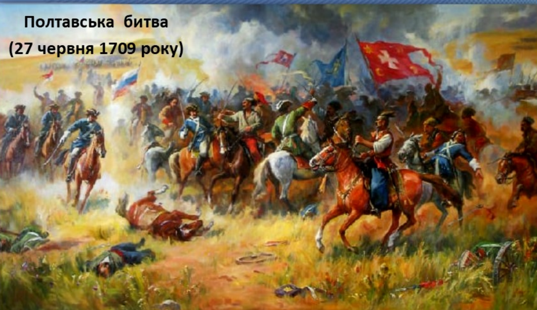
Полтавська битва (27 червня 1709 року)

За цей вчинок гетьман Мазепа був оголошений зрадником. Українці, які підтримували його, знищувалися. Московське військо зруйнувало Запорізьку Січ, знищило гетьманську столицю – місто Батурин, жорстоко розтерзавши там 6 тисяч мешканців; повністю було знищено населення містечок Маячки, Нехворощі, Кишеньки, Келеберди, Переволочни. Відтоді всіх українців, що брали участь у національно-визвольному русі, росіяни зневажливо називали «мазепинцями».