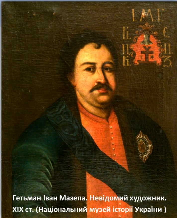
Гетьман Іван Мазепа. Невідомий художник. XIX ст. (Національний музей історії України )

Історія досі не може дати однозначну оцінку діяльності гетьмана: дехто вважає його зрадником, інші – патріотом країни. Російські історики за часів СРСР вважали відмову Мазепи від союзу з Московською державою порушенням Переяславської угоди, тому для них він був відступником, а його ім'я синонімом до слова «сепаратист». У часи перебудови вперше вчені отримали можливість трактувати діяльність гетьмана інакше. Здобуття незалежності Україною у 1991 році дозволило вивчати офіційні історичні документи без тиску загальноприйнятої думки. Після вивчення фактів в новому світлі постає образ гетьмана.