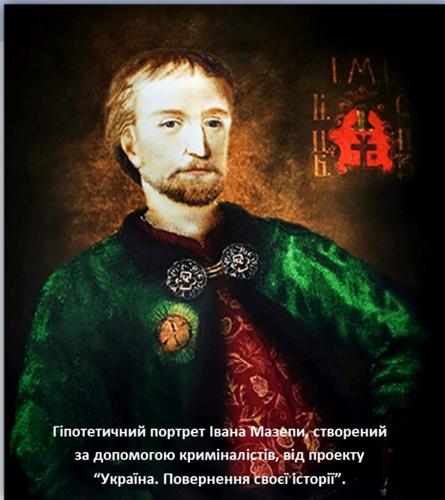
Гіпотетичний портрет Івана Мазепи, створений за допомогою криміналістів, від проекту "Україна. Повернення своєї історії".

Іван Мазепа – колоритна фігура в українській історії. Він викликав різноманітні емоції у оточуючих при житті та великі розбіжності при оцінюванні вкладу в історію батьківщини у нащадків. Вороги його сприймали як зрадника та небезпечного політика, прихильники відзначали велике прагнення гетьмана до процвітання рідної землі. Далекоглядний дипломат та мудрий полководець, поліглот та людина, закохана в мистецтво, меценат, музикант та поет, ловелас та вірний сім'янин, символ прагнення до свободи – все це про відомого гетьмана України.