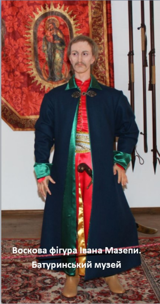
Воскова фігура Івана Мазепи. Батуринський музей

— Мазепа мав славу ловеласа та подобався жінкам, але одружившись, прожив з дружиною 35 років, не маючи власних дітей, виховував двох пасинків;