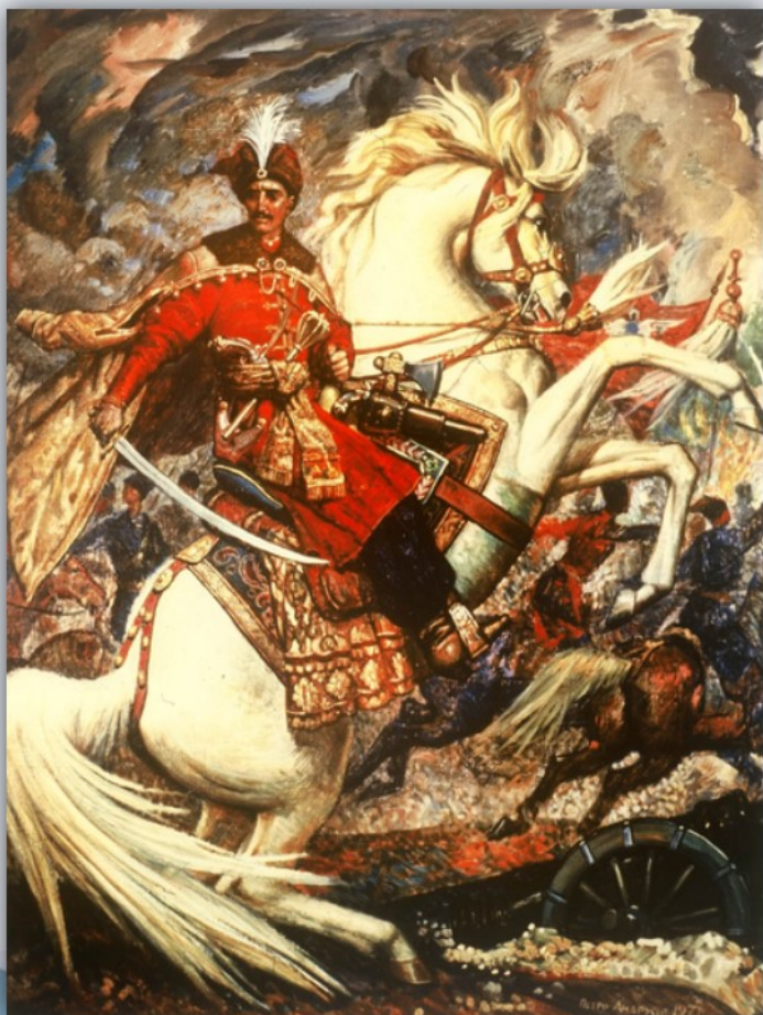
Гетьман Іван Мазепа

Вирішальна битва відбулася під Полтавою 27 червня 1709 року, яка закінчилася нищівною поразкою війська Карла XII.