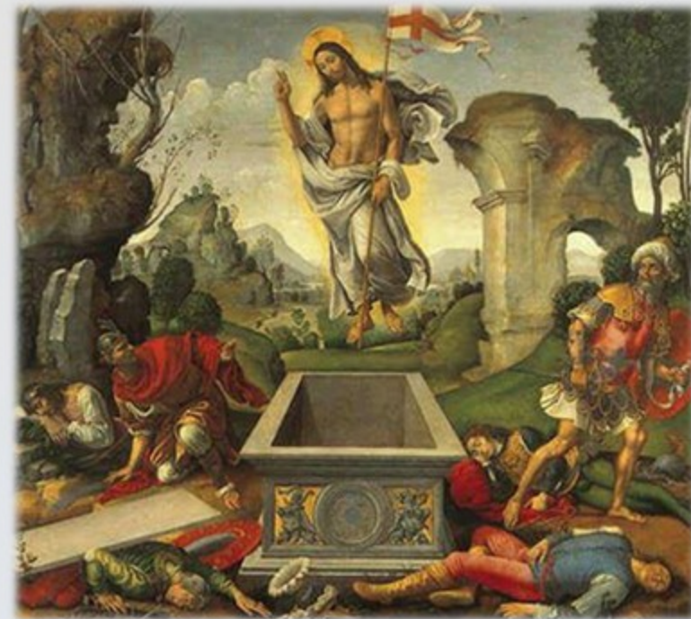
Воскресіння Христове. Рафаеліно дель Гарбо

Ще одна легенда розповідає, що першою фарбувала яйця Діва Марія, яка таким чином забавляла маленького Ісуса.