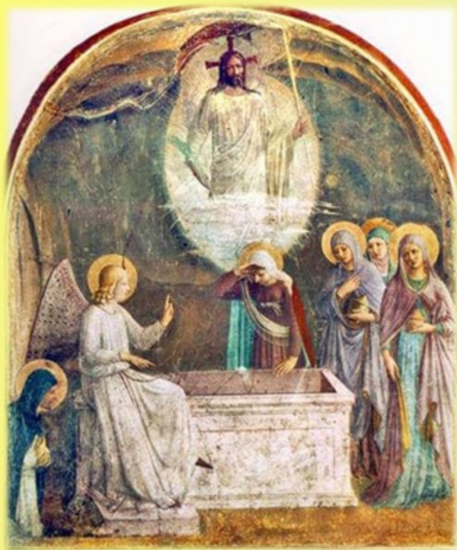
Воскресіння. Фра Беато Анжеліко. Фреска з монастиря Сан-Марко, Флоренція, сер. XV ст.