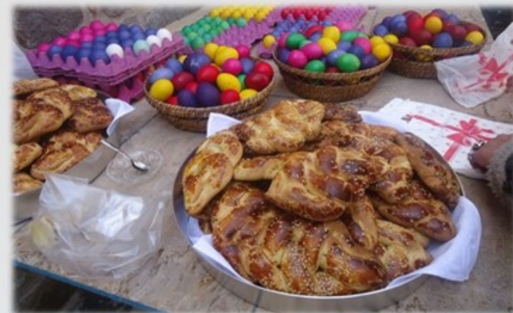
Великдень у Вірменії